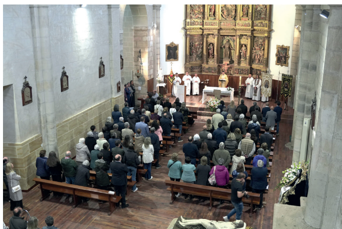
Asistentes a la Eucaristía del aniversario