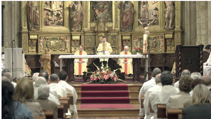
Celebración en la Concatedral de San Pedro

El presbiterio diocesano celebró el lunes 11 de mayo la fiesta de su patrón, San Juan de Ávila. El Administrador Diocesano presidió la Eucaristía en la Concatedral de San Pedro de Soria en la que se recordó a los sacerdotes que celebran alguna boda sacerdotal y a los que han fallecido durante el último año. Esta entrañable cita en la que los sacerdotes comparten un día de oración, convivencia y reconocimiento concluyó con una comida de fraternidad.