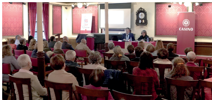
Conferencia en el Casino Amistad Numancia

El VI Domingo de Pascua, la Iglesia celebró la Pascua del enfermo, este año bajo el lema: "La compasión del samaritano: amar llevando el dolor del otro".