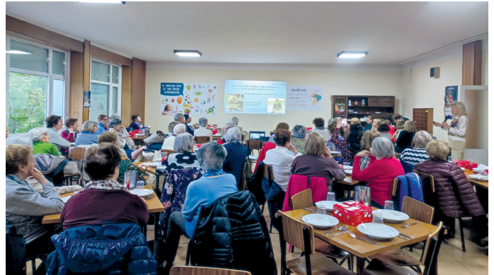
Cena solidaria a favor de Manos Unidas

Manos Unidas celebró el viernes 15 de mayo su tradicional «Cena solidaria» o «Cena del hambre» que tuvo lugar en el Colegio Santa Teresa de las Madres Escolapias. Como siempre, el Hotel Leonor proporcionó unas sopas de ajo y Nufri de La Rasa unas manzanas para completar la cena. Para Manos Unidas, esta cita también es una oportunidad para presentar a la gente los proyectos en los que trabajan durante este año y agradecer la respuesta ante todas las actividades que se organizan.