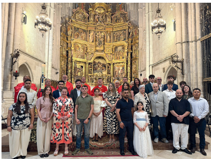
Foto de familia de los nuevos confirmados