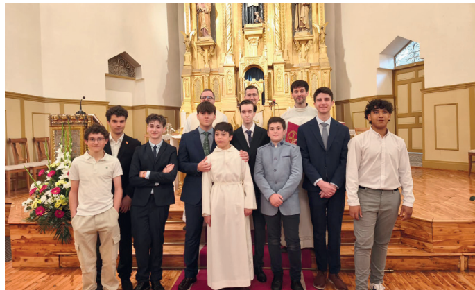
Alumnos del Seminario menor

El domingo 10 de mayo se celebró el día de las familias en nuestro Seminario Diocesano de El Burgo de Osma. Fue una jornada de encuentro y acción de gracias a Dios en la que participaron los seminaristas menores y mayores, los formadores, los profesores y el personal de servicio del centro, las familias, algunos sacerdotes de la diócesis y los amigos del Seminario.