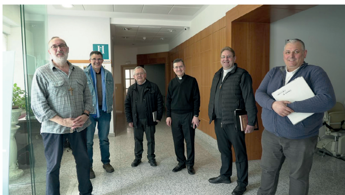
Reunión en la Casa Diocesana

El 13 de mayo tuvo lugar en la Casa diocesana de Soria la cuarta sesión ordinaria del Colegio de consultores de la diócesis de Osma-Soria, presidida por el Administrador diocesano. La reunión comenzó con un momento de oración y la lectura del acta de la sesión anterior. Posteriormente, los miembros del Colegio abordaron diversos