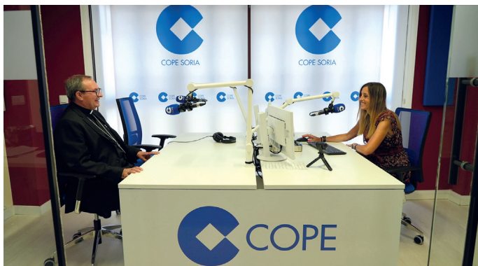
Nuevas instalaciones de COPE Soria