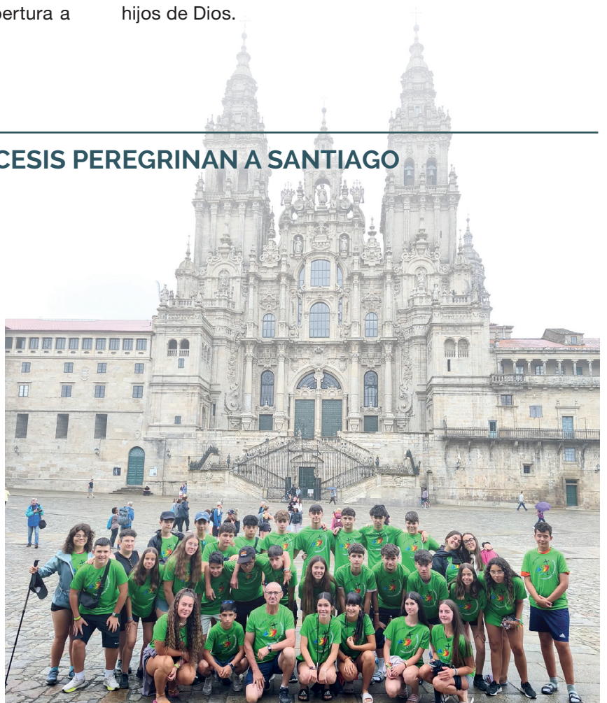
Grupo de peregrinos en la Plaza del Obradoiro