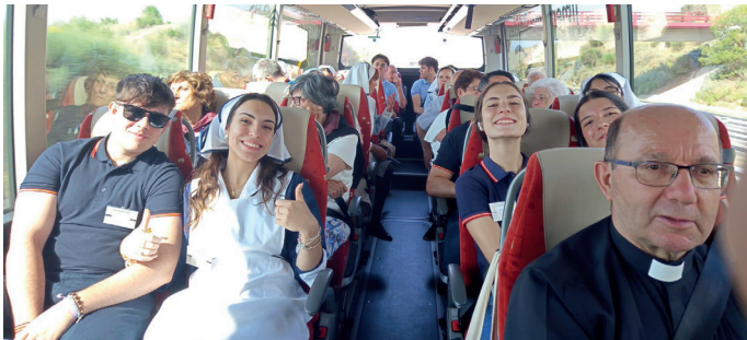
Un momento del viaje a Lourdes

Desde la salida de Soria el ambiente era de ilusión y recogimiento. Los enfermos eran asistidos por los voluntarios que les ayudaban a acomodarse y les transmitían tranquilidad y alegría. Los voluntarios de La Rioja, experimentados y siempre atentos, organizaron la acogida y el alojamiento. Desde el primer momento, se respiraba un ambiente de familia y cercanía. Los lazos entre los participantes se estrechaban con gestos sencillos: una sonrisa, una mano tendida, una palabra de aliento. El cansancio del viaje se disipaba ante la emoción de estar en un lugar tan especial, donde la Virgen María se apareció a Santa Bernardita y donde, desde entonces, millones de personas han encontrado consuelo y esperanza.