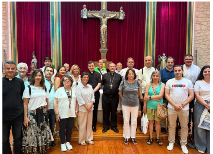
Momento de la visita al convento

La curia diocesana realizó el jueves día 17 el viaje de fin de curso en el que participaron los trabajadores, delegados y arciprestes. El destino fue la localidad de Caleruega. La visita al convento de los Dominicos ocupó buena parte de la mañana antes de la Eucaristía presidida por nuestro obispo.