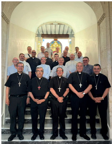
Encuentro de Iglesia en Castilla

La Diócesis de Osma-Soria fue sede de la edición de verano de las reuniones de Iglesia en Castilla: un encuentro de Obispos y Vicarios en el Seminario Diocesano Santo Domingo de Guzmán de El Burgo de Osma. El objetivo era seguir trabajando de forma conjunta de cara a la preparación de la Asamblea Eclesial de 2026.