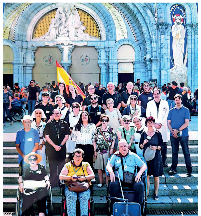
Grupo de peregrinos diocesanos