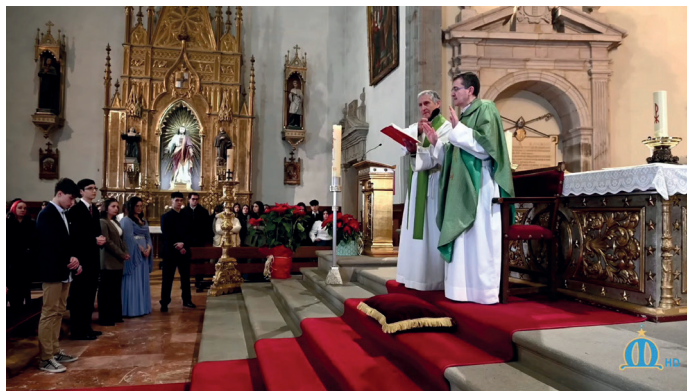
Un momento de la celebración