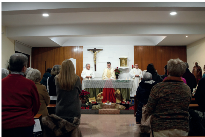
Misa celebrada en la capilla de la Hnas. Nazarenas