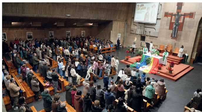
Celebración de la Jornada en la Parroquia de El Salvador