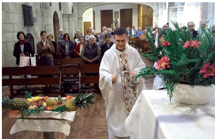
Celebración en la parroquia de San Francisco

El tiempo de oración por el cuidado de la creación se celebró del 1 de septiembre al 4 de octubre, con el lema "Semillas de paz y esperanza"; se trata de una iniciativa ecuménica para orar y actuar por la casa común, inspirada en la encíclica "Laudato si'" y en el Año Jubilar.