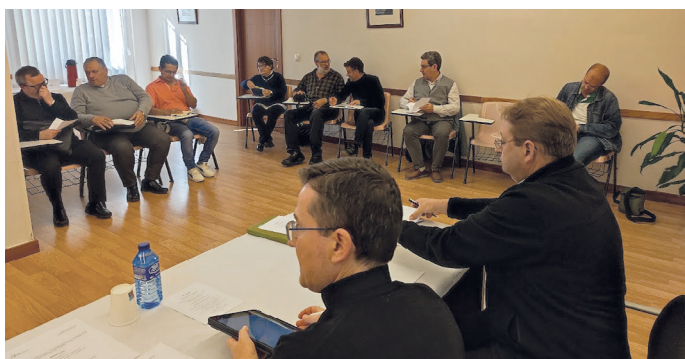
Reunión de inicio de curso

dinación entre delegaciones, activar el nuevo Servicio diocesano de pastoral vocacional y revisar los modos de comunicación y envío de materiales a las parroquias.