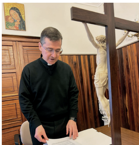
Un momento del juramento

En una carta dirigida a los sacerdotes, consagrados y fieles laicos, el nuevo Administrador diocesano expresó su disposición a servir “con sencillez y confianza” en este tiempo de transición, recordando que “la barca de la Iglesia nunca está a la deriva: Cristo está en medio de nosotros y su Espíritu sostiene nuestro camino”. Invitó, además, a vivir este período “no como un paréntesis, sino como un tiempo de gracia en el que el Señor nos llama a fortalecer la comunión, cuidar