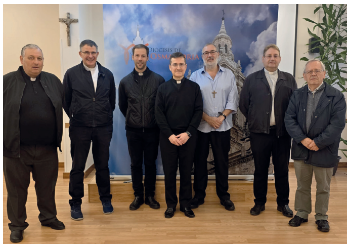
Colegio de consultores