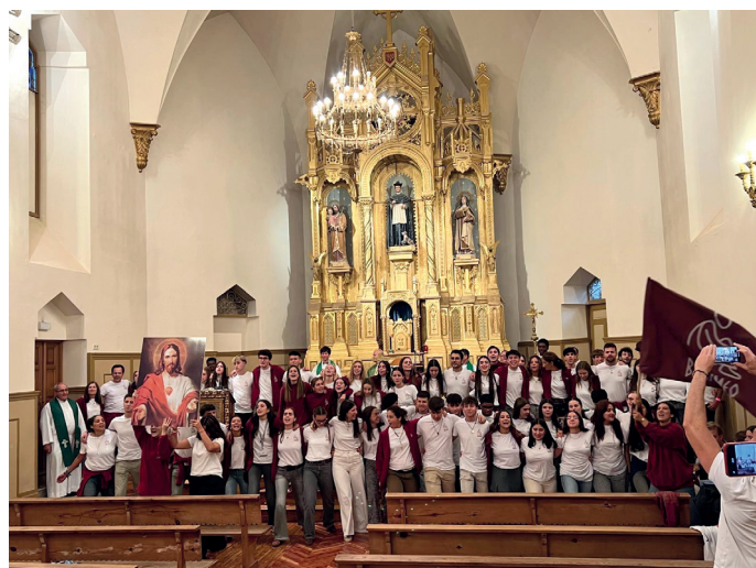
Jóvenes participantes en el retiro

Del 26 al 28 de septiembre se celebró en el Seminario por primera vez en nuestra Diócesis un retiro de Bartimeo. Durante el fin de semana, 31 jóvenes participaron en él acompañados por 41 servidores y varios sacerdotes.