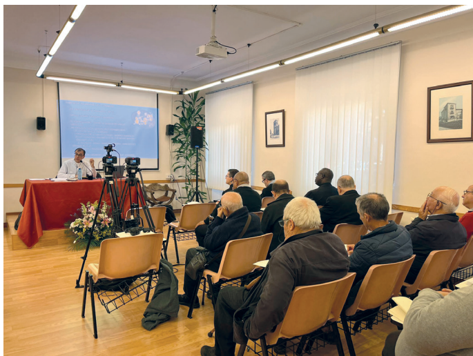
Primera de las sesiones de formación

El día 15 de octubre tuvo lugar la primera sesión de la formación permanente del clero en la Casa Diocesana de Soria. Durante el curso, las sesiones de formación estarán dedicadas al estudio y profundización del Directorio para