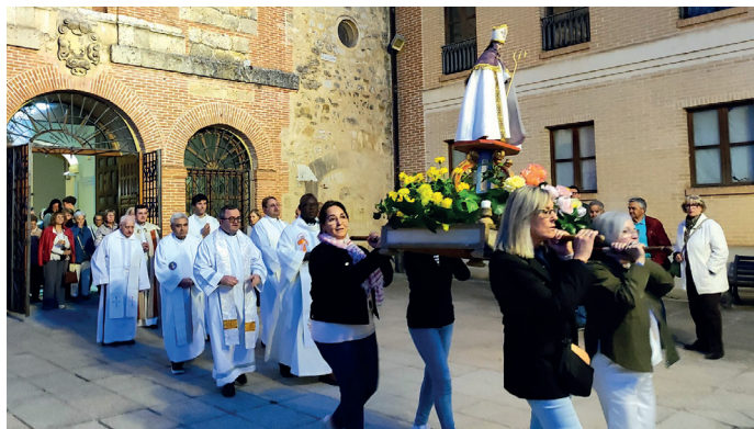
Inicio de la procesión con la imagen del Beato