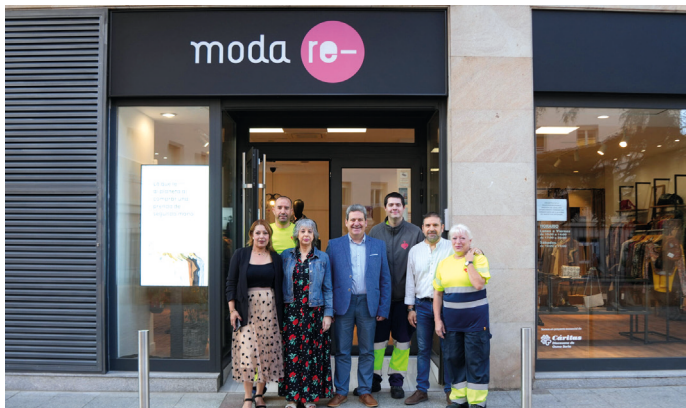
Fachada de la nueva ubicación de Moda-re

Moda re-, la cooperativa de iniciativa social sin ánimo de lucro impulsada por Cáritas Española, ha cambiado su tienda de Soria: se ha trasladado al número 11 de la calle San Juan de Rabanera. El nuevo local es más amplio y con más prendas para poder elegir, pero con los mismos precios y condiciones. El horario será el mismo: de 10 a 14 y de 17 a 20 y los sábados de 10 a 14. El personal anterior atenderá este establecimiento que busca la inserción de los desempleados mientras fomenta el aprovechamiento de las prendas de ropa.