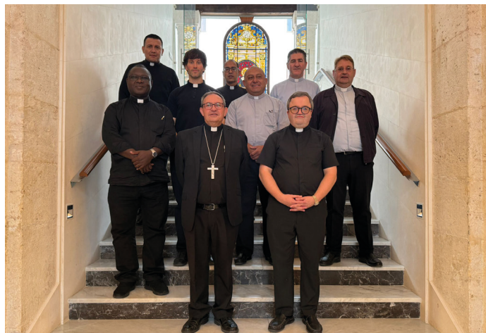
Encuentro en el Seminario

Monseñor Abilio Martínez Varea celebró el miércoles día 10 de septiembre un encuentro con los sacerdotes más jóvenes de nuestra Diócesis. El Seminario Diocesano Santo Domingo de Guzmán acogió esta cita que resultó una jornada agradable de oración, formación y cercanía para todos los participantes.