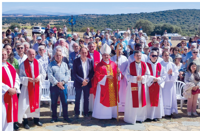
Inodejo acoge la apertura del curso pastoral