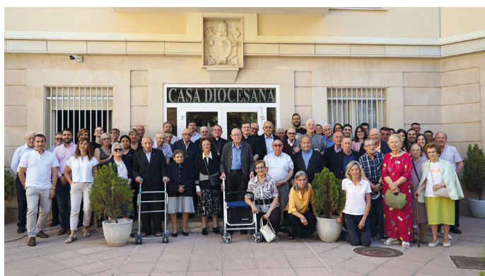
Remodelación de la Casa Diocesana

El Obispo, Monseñor Abilio Martínez Varea, presidió el día 17 la bendición de las obras de la Casa Diocesana en la calle San Juan de la capital. Los trabajos de rehabilitación se han prolongado durante 14 meses desde su inicio en enero de 2024. Con un presupuesto de 1.300.000 euros, el grueso de la intervención fue para la fachada y las cubiertas con actuaciones de impermeabilización e instalación de placas solares. Gracias a las obras, se va a lograr un importante ahorro energético tanto en electricidad como en calefacción.