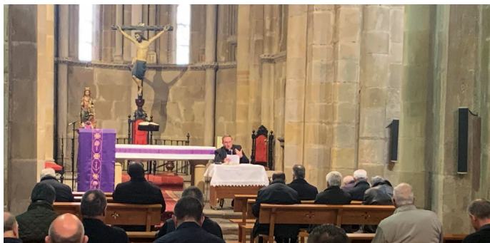
Retiro sacerdotal en San Juan de Rabanera