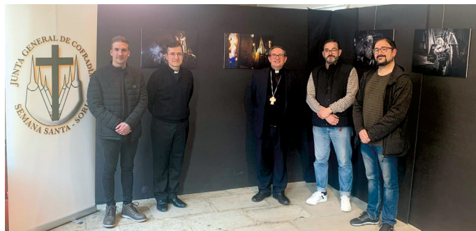
La Semana Santa en imágenes