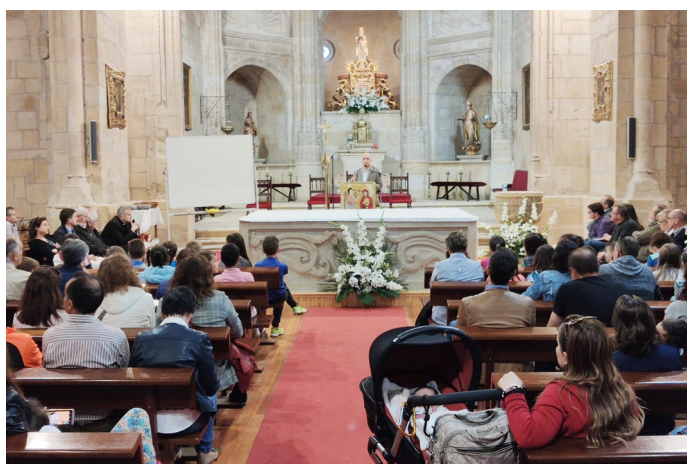
Nuevo itinerario catequético: La parroquia del Espino (Soria) presentó a las familias de la comunidad parroquial el nuevo itinerario catequético que pone en marcha desde este mismo mes.