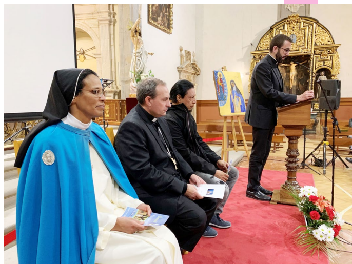
Jornadas sobre Sor María: Ágreda acogió unas Jornadas sobre Sor María de Jesús durante las que se estrenó un documental sobre la Venerable, se ofreció un recital musical y se pidió la pronta Beatificación de la mística del Moncayo.