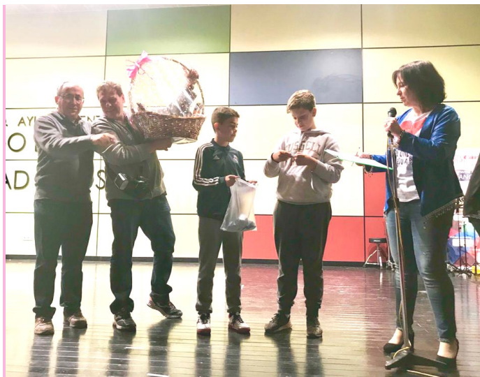
Festival benéfico para Cáritas: La parroquia de El Burgo de Osma organizó un festival benéfico a favor de Cáritas parroquial. Se recaudaron 1.500€.