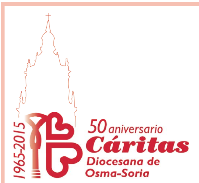
Día de la caridad (pág. 4)