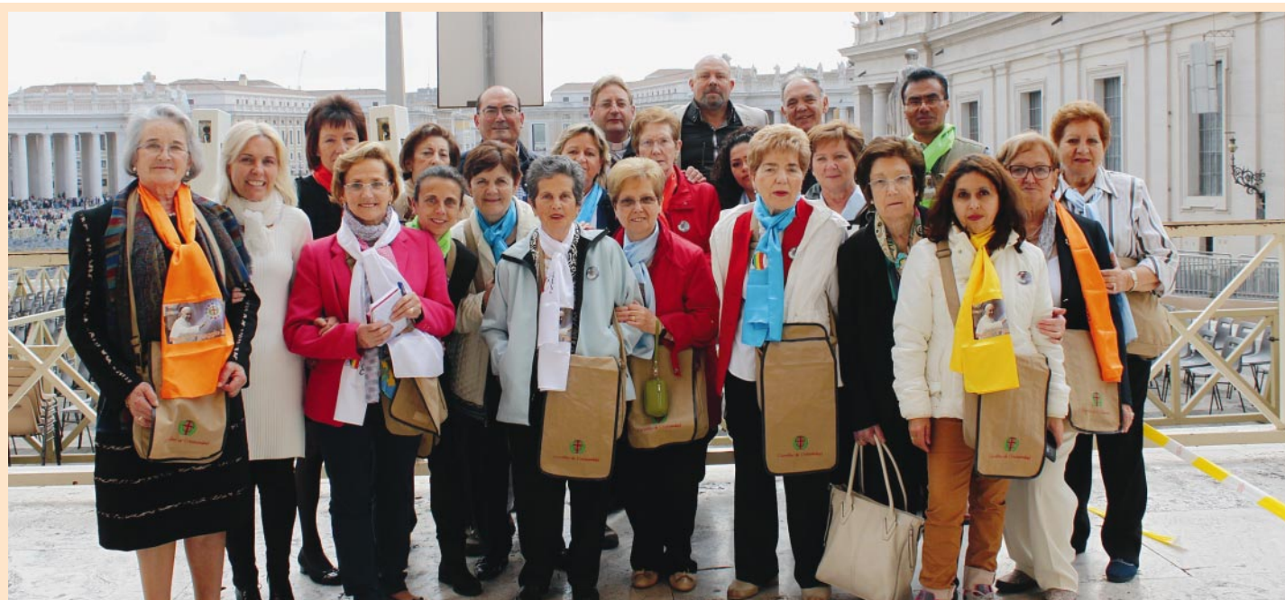
Crónica de la peregrinación del MCC diocesano a Roma (pág. 7)

HOJA DIOCESANA DE OSMÁ-SORIA • DELEGACIÓN DE M.C.S. • AÑO XXIV - Nº 524 • 1-15 JUNIO 2015