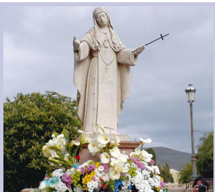
Ágreda se vuelca con la Venerable Sor María de Jesús (pág. 5)