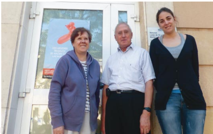
Los voluntarios de Cáritas, el gran tesoro de la ONGD.