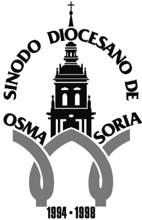
Logotipo del Sínodo Diocesano