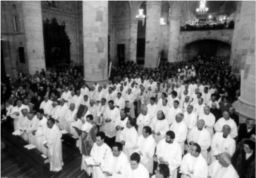
Clausura del Sínodo Diocesano (Concatedral de San Pedro de Soria, 27 de Diciembre de 1998)