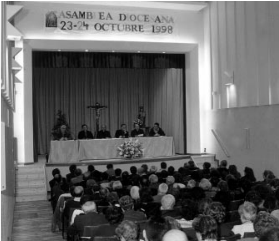
Asamblea Diocesana del Sínodo (Seminario Diocesano, 23-24 de Octubre de 1998)