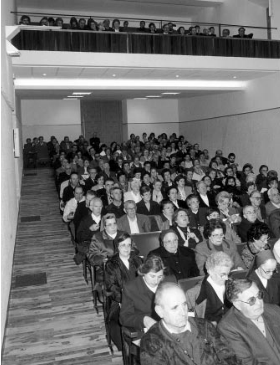
Asamblea Diocesana del Sínodo (Seminario Diocesano, 23-24 de Octubre de 1998)