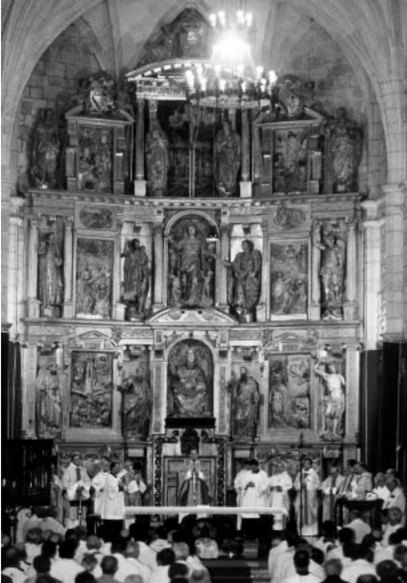
Clausura del Sínodo Diocesano (Concatedral de San Pedro de Soria, 27 de Diciembre de 1998)