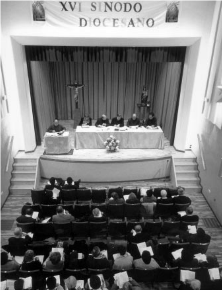
Tercera Sesión Sinodal (Seminario Diocesano, 12 de Diciembre de 1998)