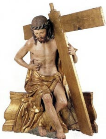
Cristo místico con la Cruz

Se encuentra en el retablo mayor de la Catedral. Obra de Juan Picardo fechada entre 1550-1556. Se trata de una talla policromada, dorada y estofada de 102 x 170 x 77 cm.